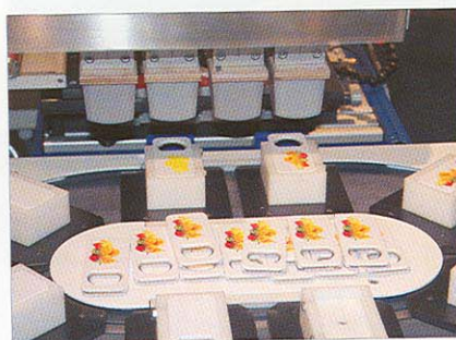
...Tampons gleichzeitig Flaschenöffner.

Im Mittelpunkt des Interesses stand in diesem Jahr eine TPE 251, die mit einer Tamponverschiebevorrichtung und einem