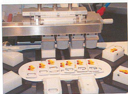
Die TPE 251 bedruckte jeweils mit zwei...

Bei der Auswahl der „richtigen“ Maschinen für den Auftritt auf der PSI hatten die Schweizer Tampondruckmaschinenhersteller von Teca Print auch in die-