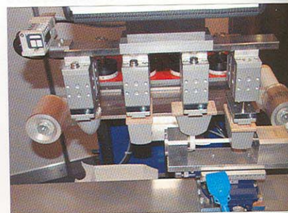
...im Rundumdruck in bunte Werbeartikel.

Inzwischen auf dem Markt bekannt, aber immer wieder als ein Blickfang, wurde eine TPX 301 präsentiert, die mit der von Teca-Print entwickelten Methode eines sich vorwärts bewegenden Tampons rundum Ku-