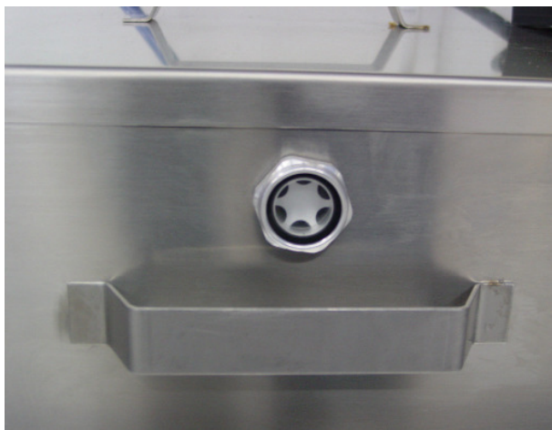
Photo: Schauglas für Füllstand Behälter

Der jeweilige Füllstand der Lösemittelbehälter wird über ein Schauglas angezeigt und muss vor Arbeitsbeginn kontrolliert werden.